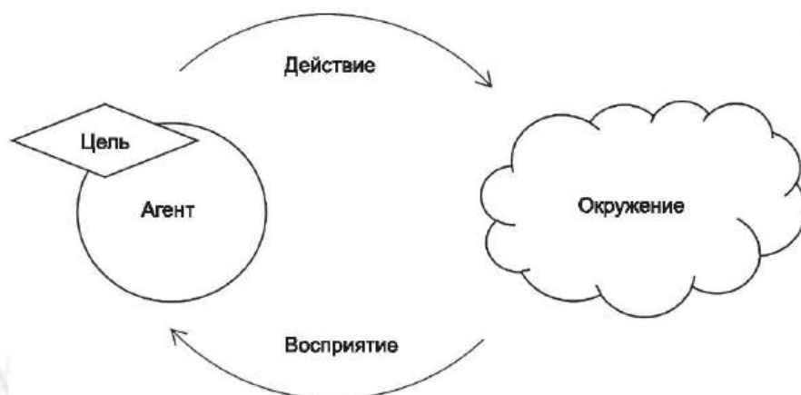
Рисунок 1 — Парадигма агента

Атрибуты позволяют разработчику ИИ сгенерировать в области другую сущность из уже существующей сущности. Атрибуты должны быть ограничены в спецификации робастности.