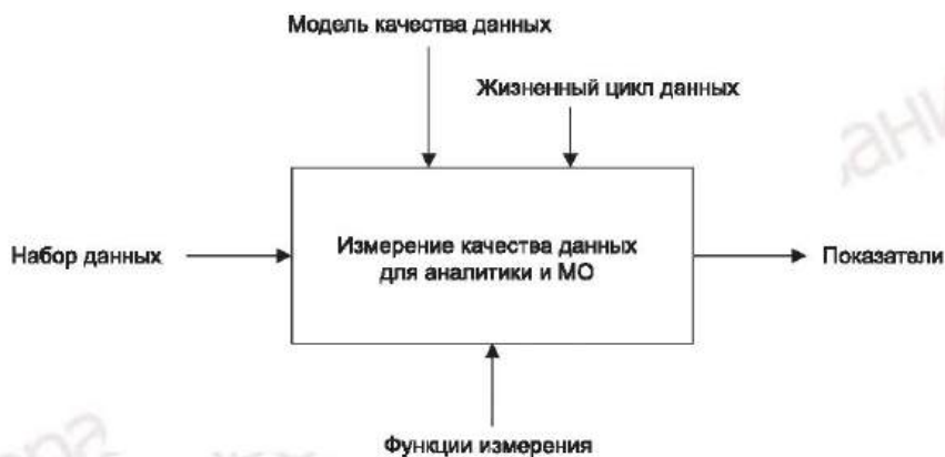
Рисунок 4 — Информация о показателях качества данных для отчетов о качестве