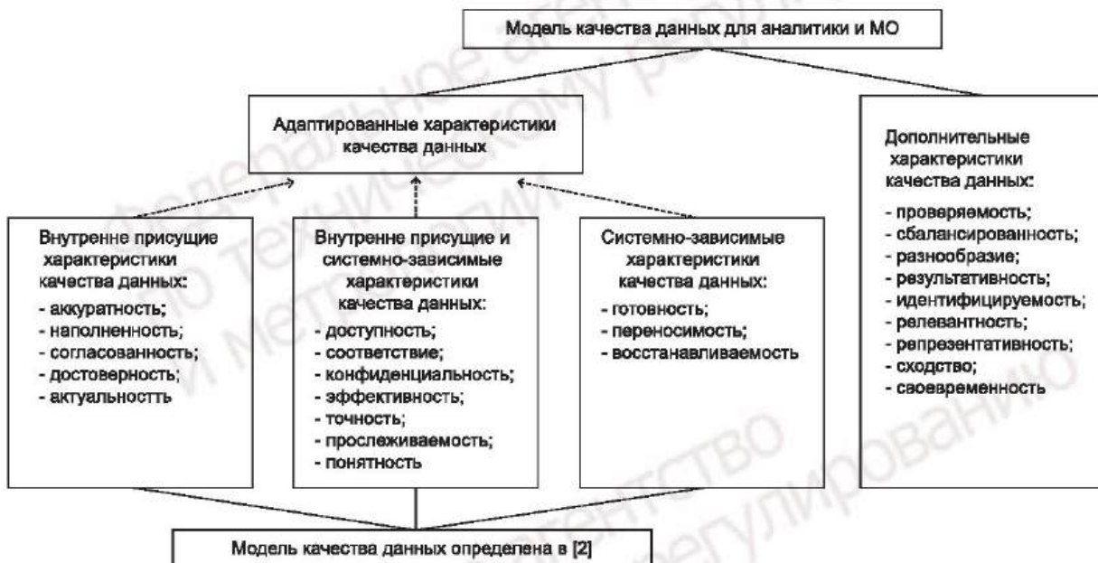
Рисунок 3 — Характеристики качества данных для аналитики и машинного обучения