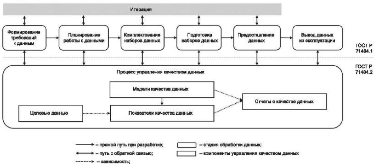
Рисунок 1 — Компоненты качества данных в жизненном цикле данных для аналитики и машинного обучения

На рисунке 1 показаны компоненты качества данных, соответствующие модели жизненного цикла данных, представленной в ГОСТ Р 71484.1—2024 (рисунок 3), которая может поддерживать процессы управления качеством данных. ГОСТ Р 71484.1 определяет модель качества данных как определенный набор характеристик качества данных. Характеристика качества данных обеспечивает основу для требований к качеству данных и методов оценки. Показатели качества данных — это присвоенные переменные, значения которых являются результатами измерений характеристик качества данных. Показатели качества данных используются для оценки того, соответствуют ли данные требованиям к качеству данных. Показатели качества данных также можно использовать для мониторинга и составления отчетов о качестве данных.