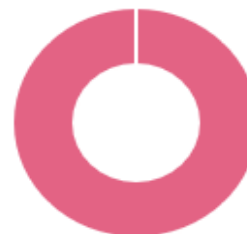
Общее количество тренеров