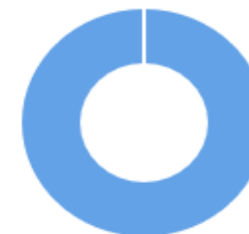
Общее количество судей