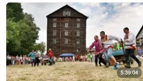
VII Межрегиональный фестиваль-состязан... 141 238 просмотров