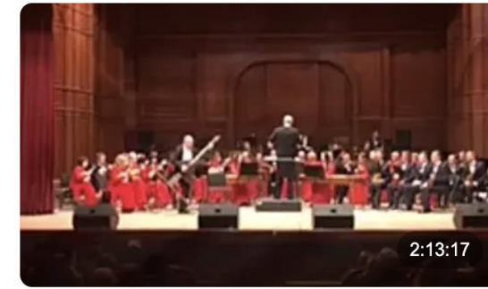
Концерт «В острых ритмах». Исполняет орк... 268 030 просмотров