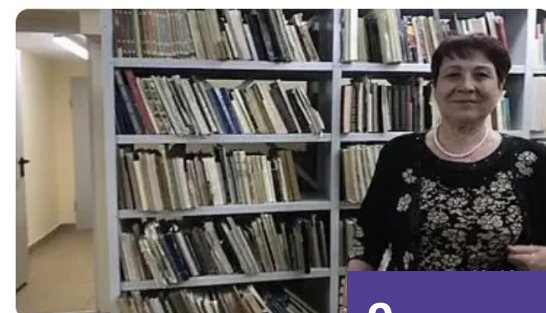
Акция «Библионочь. Читаем» 134 653 просмотра