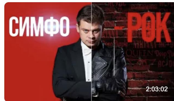
Симфо-рок. Белгородская филармония. Ди... 580 725 просмотров