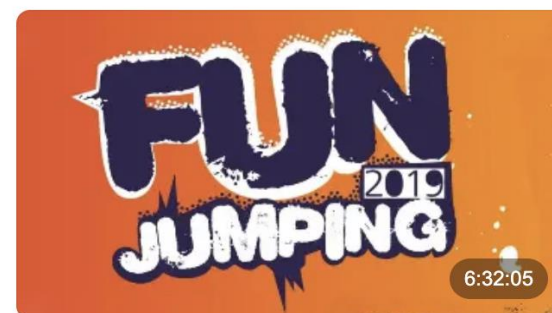
FUN JUMPING 2019 129 185 просмотров